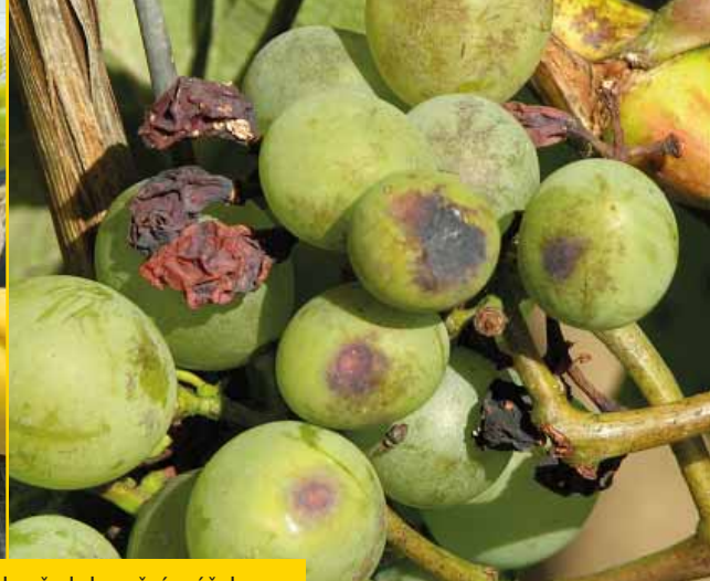
SuperAgrovital ochrání plody před slunečním úžehem