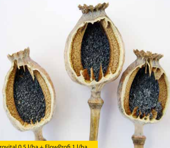
Účinek ošetření kombinací SuperAgrovital 0,5 l/ha + FlowProfi 1 l/ha na kvalitu máku (vlevo mák z neošetřeného porostu)