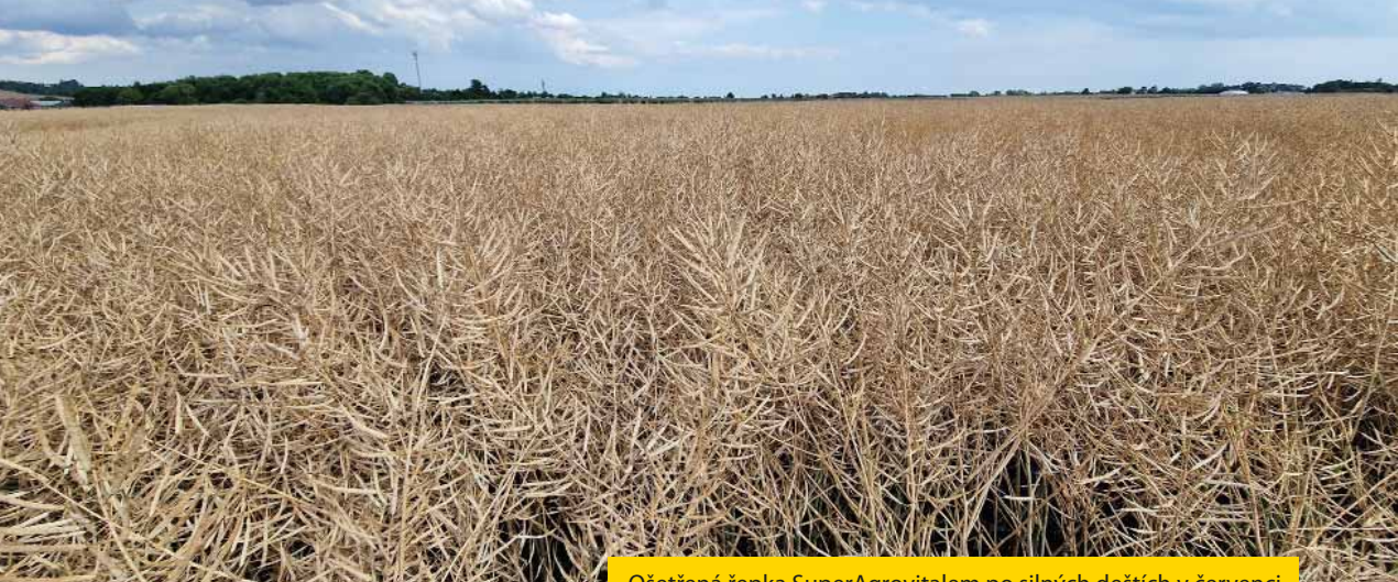
Ošetřená řepka SuperAgrovitem po silných deštích v červenci