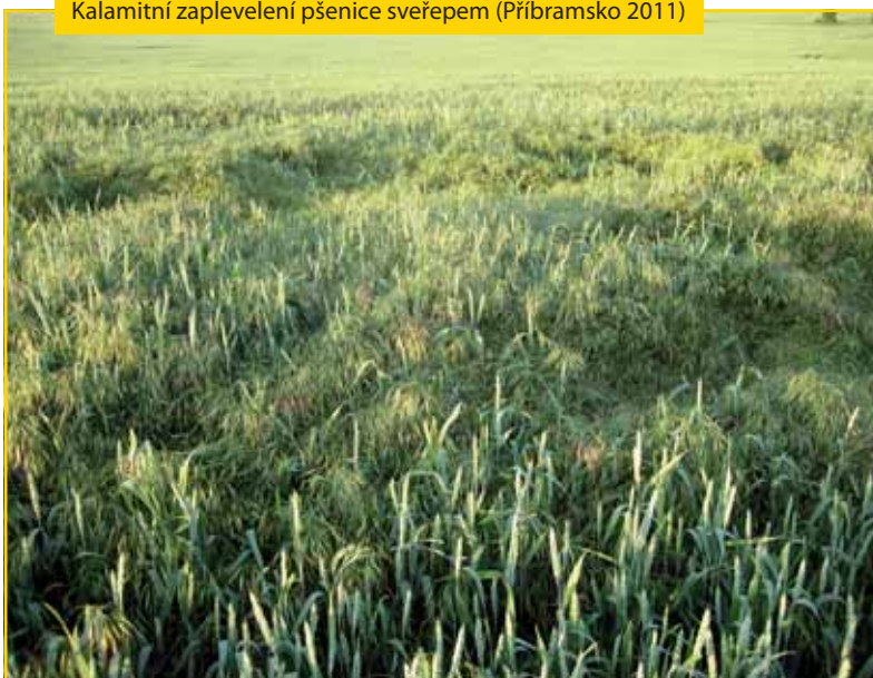
Kalamitní zaplevelení pšenice sveřepem (Příbramsko 2011)

Přípravek nedoporučujeme aplikovat na porost poškozený škůdci nebo oslabený nepříznivými povětrnostními podmínkami (např. mraz, kroupy či období chladu) a podmáčením.